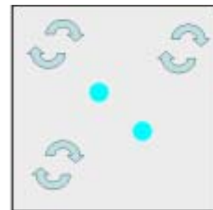
図2 共通特徴が無い場合の社会全体の文化のダイナミクス。